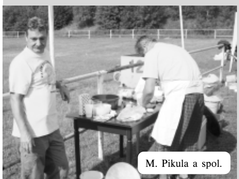
M. Pikula a spol.