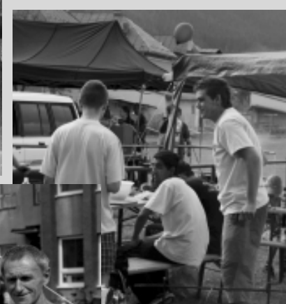
Hasiči - 3. miesto