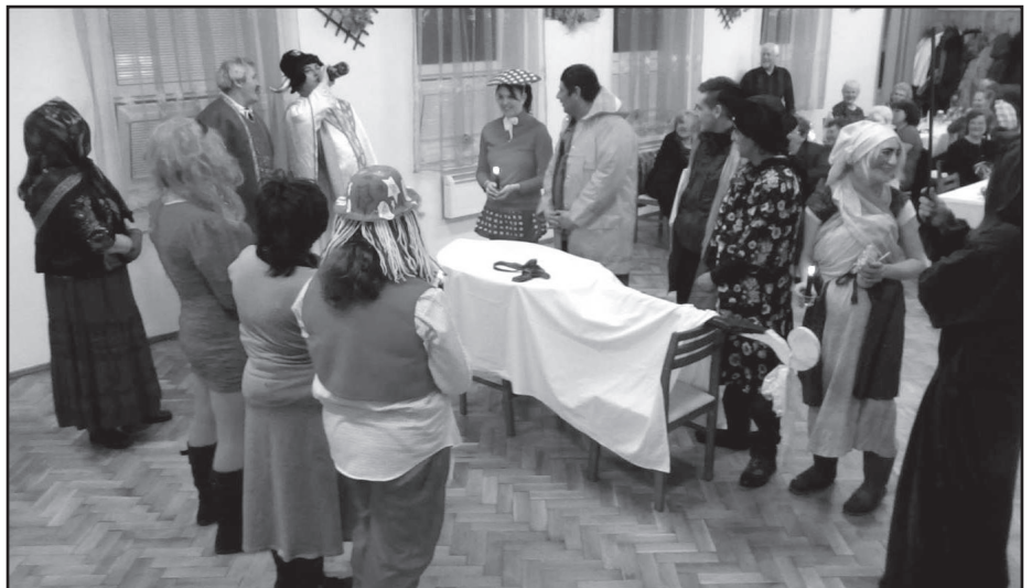
Aj moderná doba oživuje staré zvyky - 13. februára sme v spoločenskom dome takto pochovávali basu, aby sme ukončili obdobie zábavy a vstúpili do obdobia pôstu.