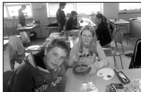
vo vestibule našej školy. Veríme, že rodičom sa naše výrobky páčili.

Naše školské akcie, ktoré sme organizovali v mesiacoch marec a apríl, sme zoradili od najmladšej po najstaršiu.