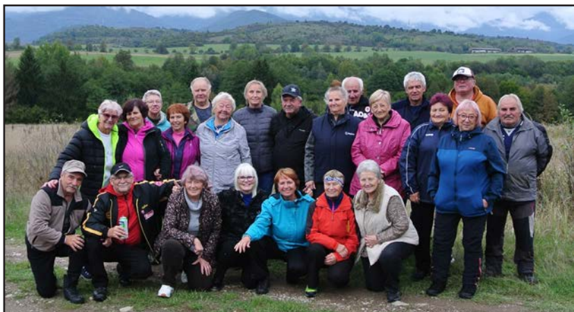
Spoločná opekačka s členmi ZO JDS Nemecká Predajnianska slatina 3. október 2024