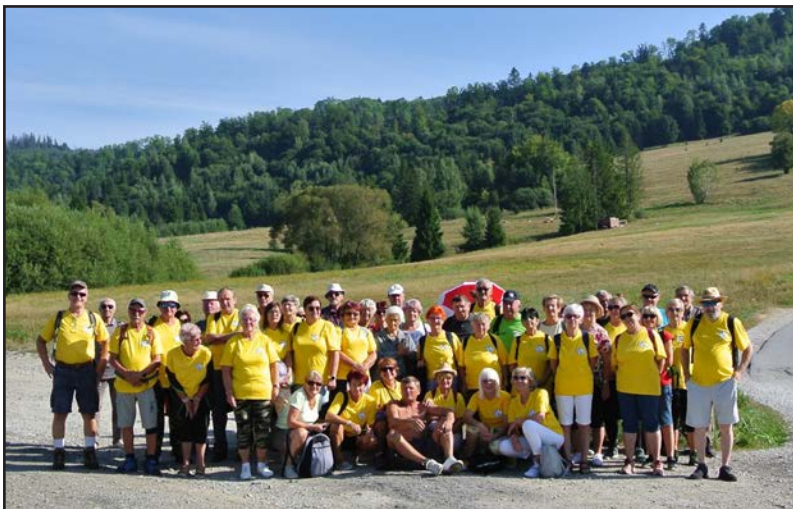
Okresný zraz seniorov ZO JDS Zbojská 4. september 2024