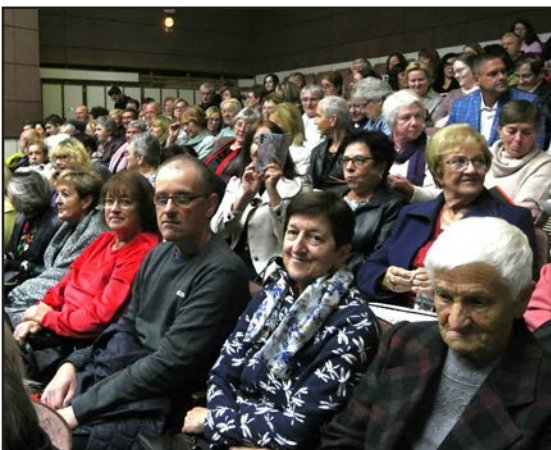
Divadelné predstavenie Príbeh duchov v Slovenskej Lupči 29. september 2024