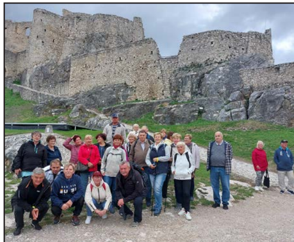
Na spoločnom výlete s členmi ZO JDS Nemecká v Levoči a na Spišskom hrade 26. september 2024